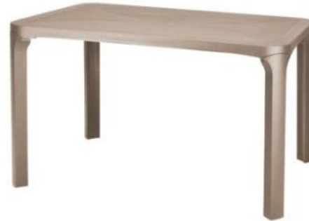
OST. EN Rechteck