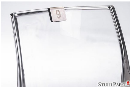
Nummerierung Klemme Mittel